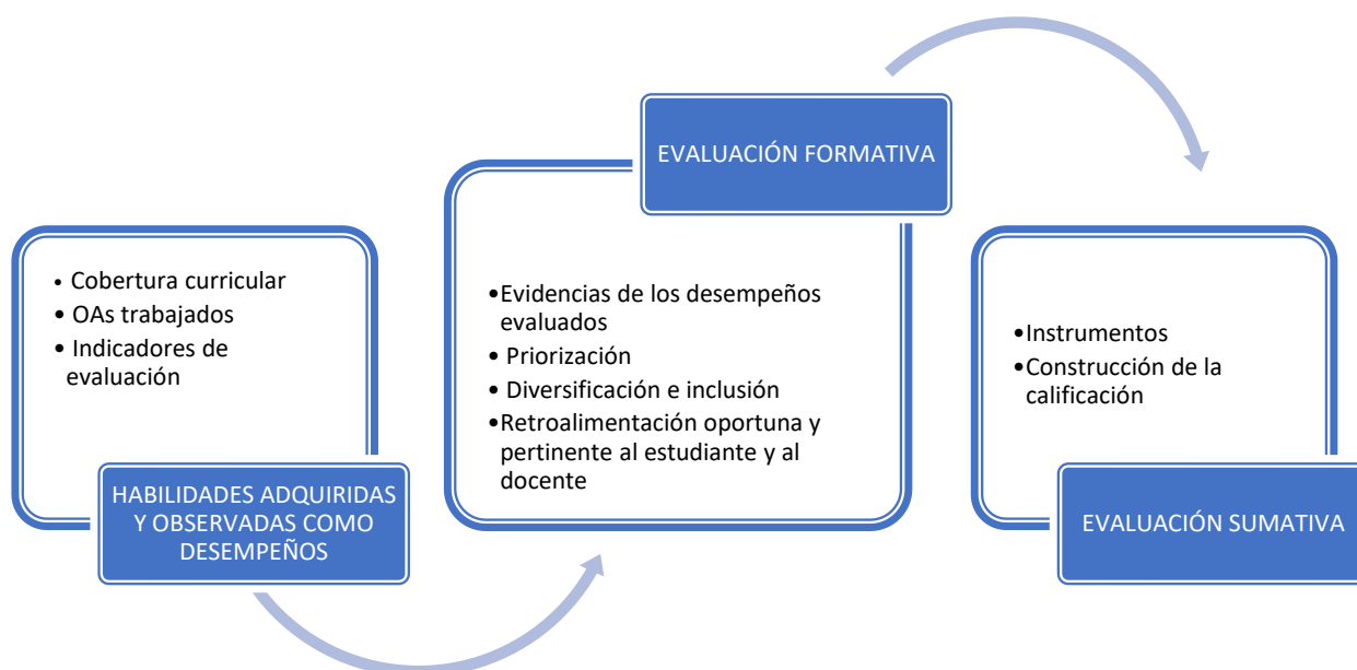
Ilustración 1: Componentes y proceso de la Evaluación de Aula

En la ilustración se describe el ciclo del proceso de evaluación del aula, tomando en consideración que lo que se evalúa es la evidencia del desempeño de los estudiantes definido en el Currículum Nacional. A través del análisis de la cobertura curricular implementada se visualizan los Objetivos de Aprendizaje trabajados con sus respectivos indicadores de evaluación, expresados como desempeños observables de los estudiantes.